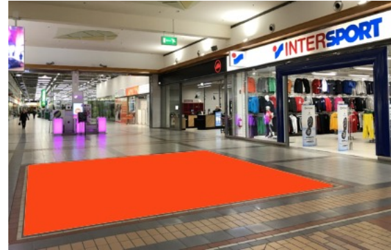
Paikka 2 · Intersport 6 x 5 m Ei sähköä, ei myyntipromootiota