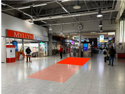
Paikka 1 · Myllyn Apteekki 3 x 4 m Optio laajentaa paikka 3 x 10 m