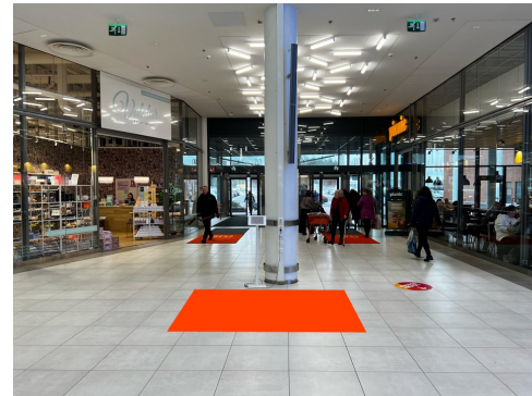
Paikka 5 · Picnic 2 x 2,5 m