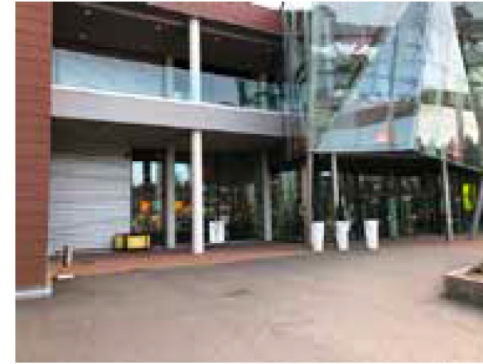
Paikka 7 · Ulkopaikka, sähköt tilattava