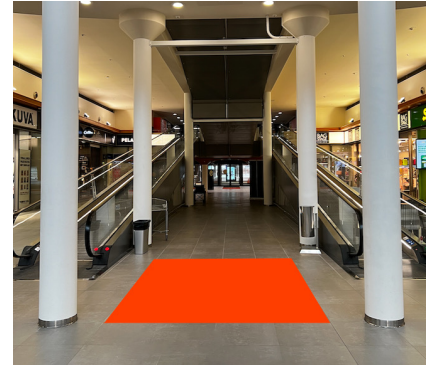
Paikka 3 · Myllyntori 2,5 x 2,5 m Sähköt tilattava