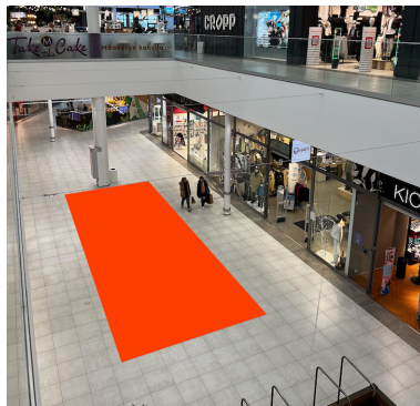
Paikka 4 · Halti 4 x 10 m